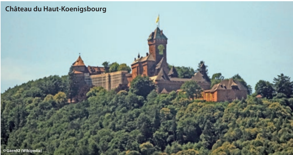
Château du Haut-Koenigsbourg