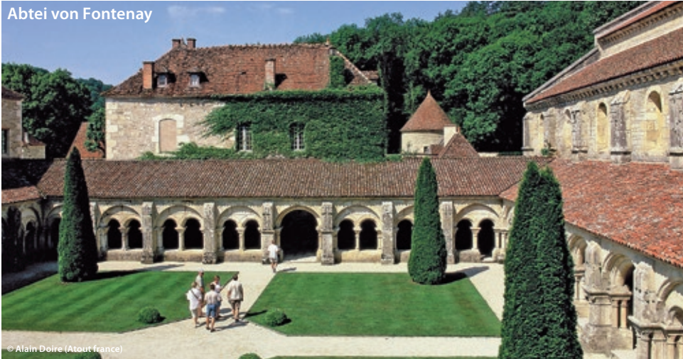
Abtei von Fontenay