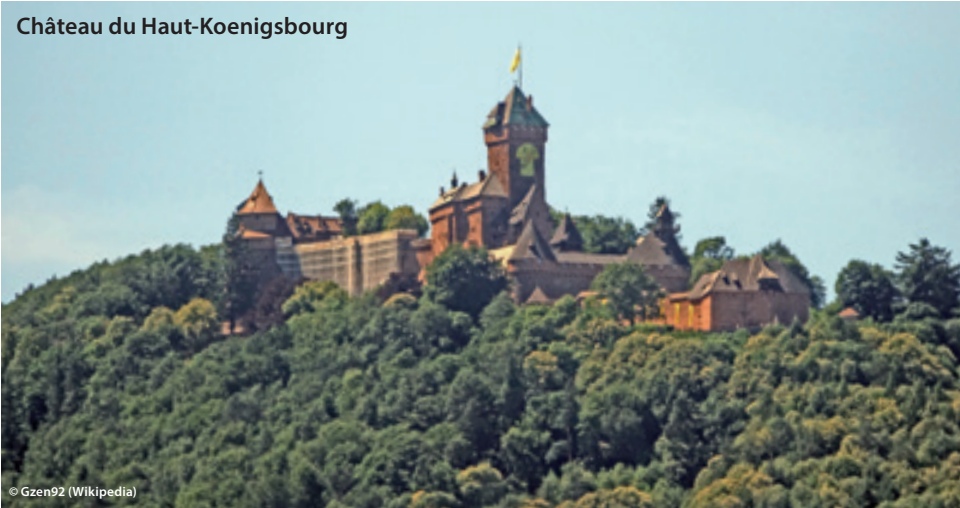
Château du Haut-Koenigsbourg