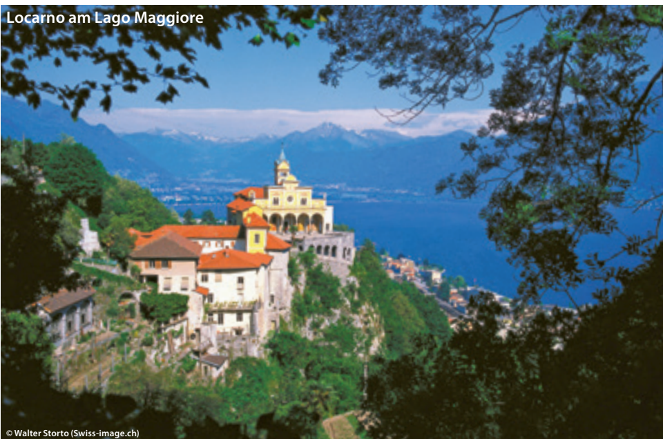
Locarno am Lago Maggiore