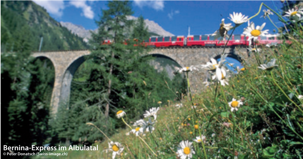
Bernina-Express im Albulatal