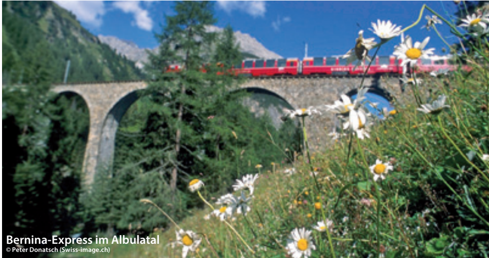
Bernina-Express im Albulatal