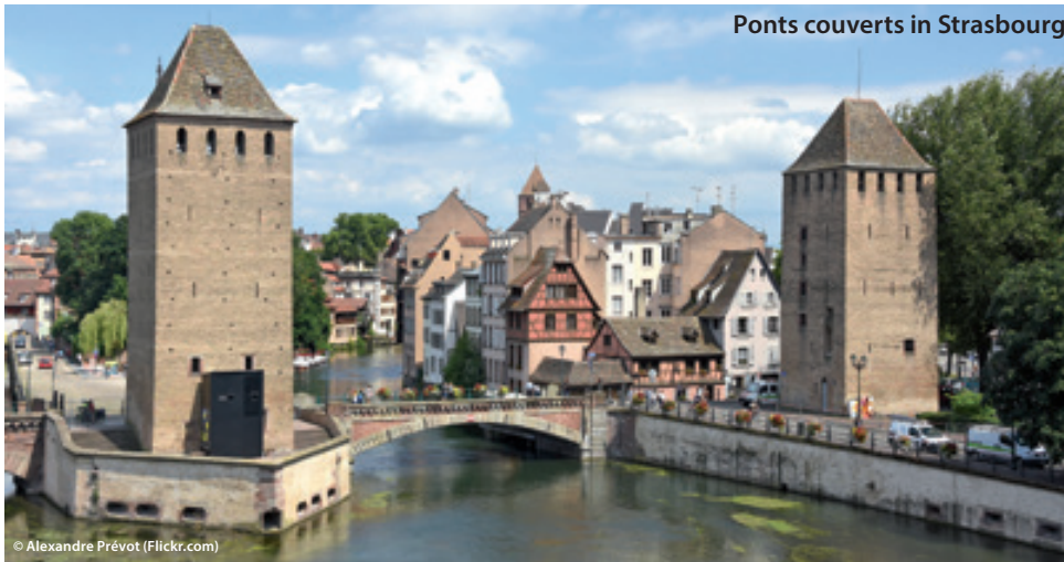
Pons couverts in Strasbourg