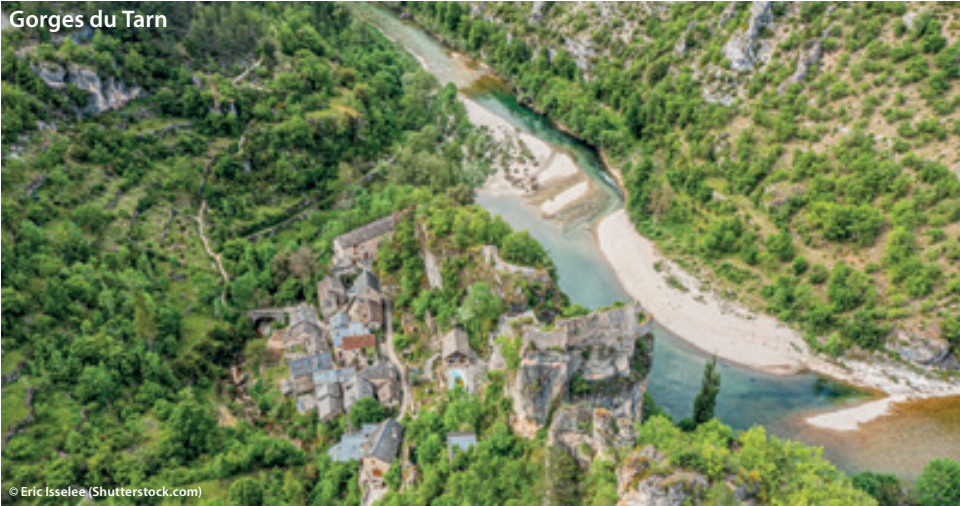
Gorges du Tarn