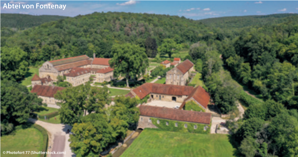
Abtei von Fontenay