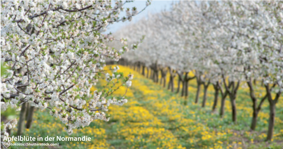
Apfelblüte in der Normandie