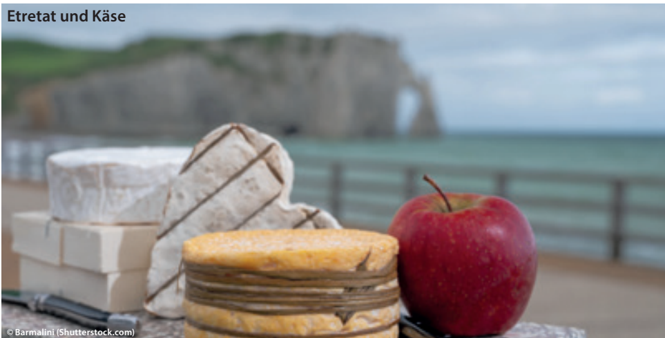
Etretat und Käse